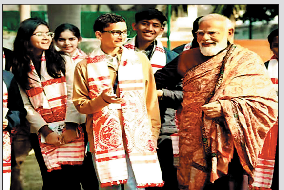
अलग पैटर्न समझते हैं, जबकि छात्र का अपना तरीका होता है. इस पर पीएम मोदी ने कहा कि यह पैटर्न जीवनभर चलता है. उन्होंने उदाहरण देते हुए कहा कि वे प्रधानमंत्री बन गए, फिर भी

नई दिल्ली, 06 फरवरी. प्रधानमंत्री नरेंद्र मोदी ने 'परीक्षा पे चर्चा' कार्यक्रम में छात्रों को पढ़ाई के लिए एक महत्वपूर्ण मंत्र दिया. उन्होंने कहा कि पढ़ाई का तरीका हर व्यक्ति का अलग होता है और छात्रों को अपने पैटर्न के अनुसार पढ़ना चाहिए. सबकी सलाह सुननी चाहिए, लेकिन अपना तरीका तभी बदलें जब आपको खुद से फायदा नजर आए.