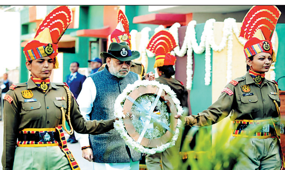
सेवा का तैयारी रहेगा। श्रद्धांजलि के बाद अमित शाह ने भारत-पाकिस्तान सीमा पर स्थित गुरनाम बॉर्डर आउट पोस्ट का दौरा किया। कठिन भौगोलिक परिस्थितियों और चुनौतीपूर्ण हालात में तैनात जवानों से मुलाकात कर उन्होंने सीमा सुरक्षा की तैयारियों का जायजा लिया और जवानों से संवाद किया। इस दौरान गृह मंत्री ने कहा कि विपरीत परिस्थितियों में भी जिस साहस, अनुशासन और प्रतिबद्धता के साथ जवान देश की सीमाओं की रक्षा कर रहे हैं, उस पर पूरे देश को गर्व है।

नई दिल्ली, 06 फरवरी। गृह मंत्री अमित शाह ने शुक्रवार को जम्मू-कश्मीर के दौरे के दौरान राष्ट्र की सीमाओं की रक्षा में सर्वोच्च बलिदान देने वाले वीर जवानों को श्रद्धांजलि अर्पित की। उन्होंने बोखिया वीओपी स्थित शहीद स्मारक 'अजेय प्रहरी' पर पुष्पांजलि अर्पित कर शहीदों के अदम्य साहस और शौर्य को नमन किया। शाह ने कहा कि आपदा हो या सीमा बीएसएफ हमेशा आगे है.