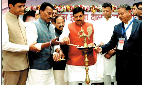
उदाहरण देते हुए उन्होंने बताया कि सरकार ने पहल कर करीब सात हजार मजदूरों को उनकी मेहनत की राशि दिलाई. इंदौर में अंतरराष्ट्रीय प्रदर्शनी ग्रेनेक्स इंडिया-2026 के उद्घाटन पर मुख्यमंत्री ने कहा कि

इंदौर, 06 फरवरी. मुख्यमंत्री डॉ. मोहन यादव ने कहा है कि प्रदेश में उद्योगपतियों को किसी भी परिस्थिति में चिंता करने की जरूरत नहीं है. सरकार नए उद्योगों को जमीन, नियमों में सरलता और अन्य सुविधाएं उपलब्ध करा रही है और उद्योग बंद होने की स्थिति में भी नुकसान नहीं होने दिया जाएगा.