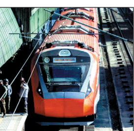
अधिक 285 ट्रेनों का संचालन पूर्व मध्य रेलवे करेगा. पश्चिम रेलवे 231 और मध्य रेलवे 209 होली स्पेशल ट्रेनें चलाएगा. दक्षिण मध्य रेलवे 160, उत्तर रेलवे 108 और उत्तर पश्चिम रेलवे 71 ट्रेनें संचालित करेगा.

नई दिल्ली, 06 फरवरी. भारतीय रेलवे ने होली के त्योहार के दौरान यात्रियों की बढ़ती मांग को देखते हुए अपने नेटवर्क पर 1,410 से अधिक होली स्पेशल ट्रेनों के संचालन की योजना बनाई है, जो आवश्यकतानुसार 1,500 तक बढ़ सकती हैं. ये ट्रेनें मार्च में चलेंगी और प्रमुख गंतव्यों के बीच बेहतर कनेक्टिविटी सुनिश्चित करेंगी. पिछले वर्ष 2025 में 1,144 होली स्पेशल ट्रेनों का संचालन हुआ था.