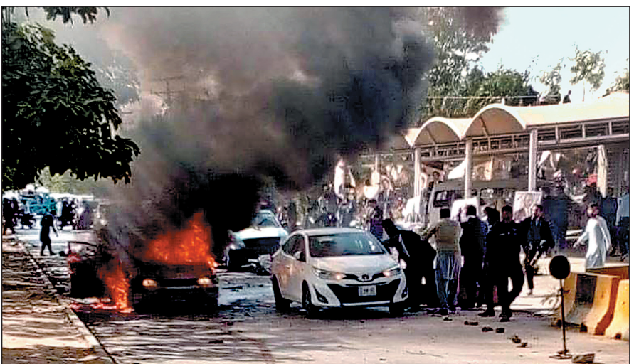
रोकने के बाद उसने खुद को बम से उड़ा लिया. धमाके से मस्जिद के गेट की संरचना क्षतिग्रस्त हो गई और आसपास की इमारतों की खिड़कियां तक टूट गई. ब्लास्ट के बाद मलबा सड़क पर फैला नजर आया और मौके पर बचाव दल एवं पुलिस पहुंच गई. घायलों को फेडरल कैम्पिटल के

इस्लामाबाद, 06 फरवरी. पाकिस्तान की राजधानी इस्लामाबाद में शुक्रवार को एक शिया मस्जिद में जुमे की नमाज के दौरान एक बड़ा फिदायीन हमला हुआ. सूत्रों के अनुसार इस बम ब्लास्ट में अब तक 69 लोगों की मौत हो चुकी है और 169 से अधिक लोग घायल हैं. घटना शहजाद टाउन के तरलाई इलाके में स्थित खदीजतुल कुबरा मस्जिद-कम-इमामबाड़ा में हुई. इसके पहले 11 नवम्बर को कोर्ट में आत्मघाती धमाका में 12 की मौत हुई थी.