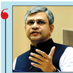
श्री वैष्णव ने भू-राजनीति में एआई की भूमिका की चर्चा करते हुए कहा, जिसे मैं पांचवीं औद्योगिक क्रांति कहता हूँ, उससे आर्थिक लाभ अधिकतम संभव रिटर्न पाने के लिए निम्नतम लागत समाधान लागू करने से आयेगी. उन्होंने इस बात पर जोर दिया कि एआई के प्रभावी इस्तेमाल से तेजी से सीपीयू, छोटें मॉडल और उभरते कर्टम सिलिकॉन पर निर्भर करने लगी है, जिससे किसी एक देश पर निर्भरता कम होती है और केवल आकार के आधार पर एआई के प्रभुत्व की धारणा को चुनौती मिलती है. मंत्री ने भारत की डिजिटल सार्वजनिक अवसंरचना की सफलता का उदाहरण देते हुए कहा कि सरकार जीवन और अर्थव्यवस्था के हर क्षेत्र में एआई के प्रसार को प्रणालीगत तरीके से आगे बढ़ा रही है.

श्री वैष्णव ने मंगलवार को दावोस में विश्व आर्थिक मंच (डब्ल्यूईएफ) में एआई पावर प्ले, नो रेफरेंस शीफक पर आयोजित परिचर्चा के दौरान वैश्विक एआई गठबंधनों और भू-राजनीति से संबंधित एक प्रश्न के उत्तर में कहा कि एआई के मामले में भारत स्पष्ट रूप से विकसित देशों के अग्रणी समूह में शामिल है. उन्होंने कहा कि एआई में निवेश पर लाभ केवल बहुत बड़े मॉडल बनाने से नहीं, बल्कि उद्यम-स्तर पर उसके