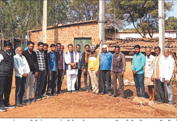
स्कूल के पास डीपी के स्ट्रेकर के नीचे धरने पर बैठ गए। इस दौरान ग्रामवासियों का कहना था कि डीपी की खराब स्थिति के कारण गांव में बार-बार बिजली बाधित हो

नवभारत न्यूज अशोकनगर। ग्राम जलालपुर में बिजली की समस्या से परेशान हो रहे ग्रामीणों द्वारा गुरुवार को विद्युत ट्रांसफार्मर के स्ट्रेकर के नीचे धरना दिया। तो वहीं इस धरने की जानकारी जैसे ही विधायक हरिबाबू राय को लगी तो वह भी मौके पर पहुंचे और ग्रामीणों के साथ धरने पर बैठ गए। वहीं विधायक के धरने पर बैठे होने की जानकारी जैसे ही विद्युत विभाग के अफसरों को लगी तो वह मौके पर पहुंचे और विधायक सहित ग्रामीणों को दो दिन में ट्रांसफार्मर रखने का आश्वासन दिया। जिसके बाद विधायक सहित ग्रामीण धरने से हटे। दरअसल विधानसभा क्षेत्र के ग्राम जलालपुर तूमैन में नवीन डीपी की गंभीर समस्या को लेकर गुरुवार को विधायक इंजी हरिबाबू राय ग्रामवासियों के साथ