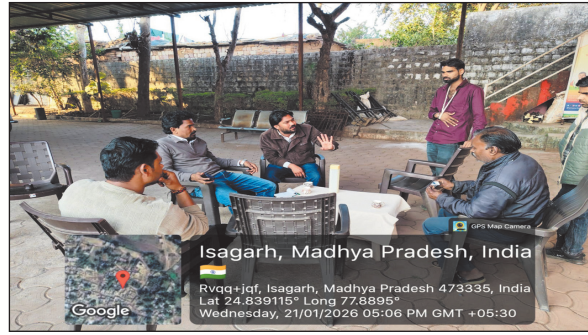
Isagarh, Madhya Pradesh, India Rvqg+Jhf, Isagarh, Madhya Pradesh 473335, India Lat: 24.839115, Long: 77.8995 Wednesday, 21/01/2026 05:06 PM GMT +05:30