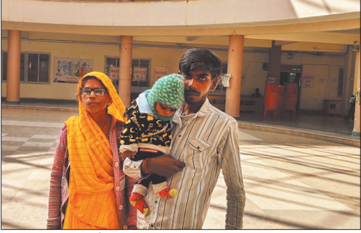
वहीं कई बार मित्रते और निवेदन करने के बाद भी योजनाओं का लाभ नहीं मिला तो उसने मंगलवार को जिला

नवभारत न्यूज अशोकनगर। जिले में ग्राम विभाग द्वारा शुरू की गई अंत्येष्टि एवं अनुग्रह सहायता योजना मजाक बन कर रह गई है, ऐसा इसलिए कहा जा रहा है कि सारे दस्तावेज होने के बाद भी इन योजनाओं का लाभ पात्र हितग्राहियों को नहीं मिल रहा है। ऐसा ही एक मामला ग्राम बांकलपुर का सामने आया है। जहां एक गरीब महिला को मृत्यु हो जाने के सात माह बाद भी न तो उसके परिवार को अंत्येष्टि राशि मिली न ही संबल कार्ड होने के बाद अनुग्रह सहायता योजना का लाभ मिला। जिसके बाद मृतक महिला का पति आए दिन अपनी छह माह की बेटी को साथ लेकर ग्राम पंचायत कार्यालय से लेकर अधिकारियों के दफ्तरों के चक्कर लगाता फिर रहा है। तो