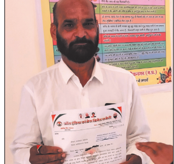
दलालों के जरिये की जाती है पैसों की मांग: ऑल इंडिया कांग्रेस विग्रोड कमेटी के प्रदेश