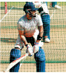
भारत-न्यूजीलैंड वनडे मैच आज