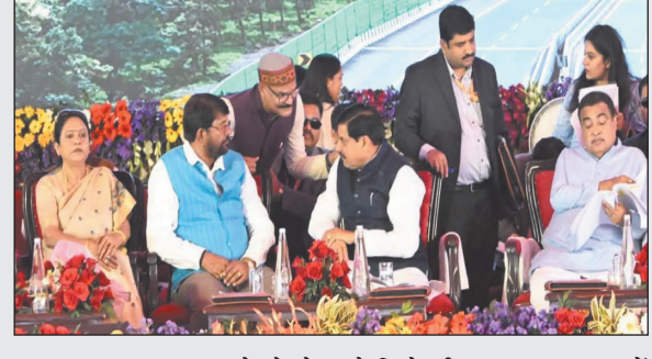
उदयपुरा (एनएच-45) को जोड़ने से जिले की यातायात व्यवस्था में

नवभारत न्यूज विदिशा, जिला पंचायत अध्यक्ष ने प्रवास पर आए केंद्रीय सड़क परिवहन एवं राजमार्ग मंत्री नितिन गडकरी से भेंट कर जिले के विकास के लिए दो बड़े विजन पत्र सौंपे. अध्यक्ष ने मंत्री को अवगत कराया कि एनएच-346 पर स्थित ग्राम हिनोलिया से गुलाबगंज और एनएच-146 पर स्थित मानोरा से गैरतगंज-सिलवानी होते हुए