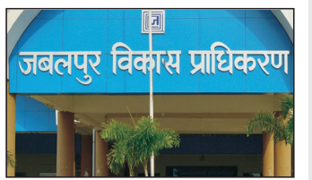
जबलपुर विकास प्राधिकरण