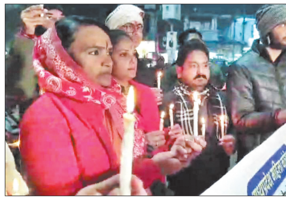
मृतकों को दी श्रद्धांजलि