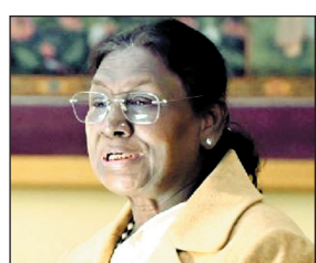
संथाली लोगों के लिए गौरव और

राष्ट्रपति सचिवालय ने बताया कि इस अवसर पर राष्ट्रपति ने कहा कि यह सभी