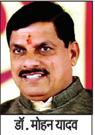
डॉ. मोहन यादव

भारत जमीन का टुकड़ा नहीं, जीता जागता राष्ट्रपुरुष है... यह चन्दन की भूमि है, अभिनन्दन की भूमि है यह तर्पण की भूमि है, यह अर्पण की भूमि है इसका कंठ-कंठ शंकर है, इसका बिन्दु-बिन्दु गंगाजल है हम जियेंगे तो इसके लिये, मरेंगे तो इसके लिये... मां भारती के लिए सर्वस्व अर्पण करने वाले पूर्व प्रधानमंत्री, भारत रत्न, राष्ट्रपुरुष श्रद्धेय अटल बिहारी वाजपेयी जी की 101वीं जयंती पर उन्हें शत शत नमन. अटलजी नवसूजन