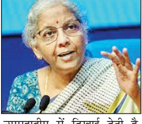
उपमहाद्वीप में दिखाई देती है.

मंत्रालय ने इस अवसर पर कॉरपोरेट कार्य राज्य मंत्री हर्ष मल्होत्रा भी उपस्थित रहे. सीतारमण ने शिविर के पहले दिन अध्यक्षीय संबोधन में विजयनगर क्षेत्र के ऐतिहासिक महत्व पर प्रकाश डाला. यह क्षेत्र लगभग 500 वर्ष पूर्व अपने उत्कर्ष पर था और उस समय अत्यधिक कीर्ति परे भारतीय