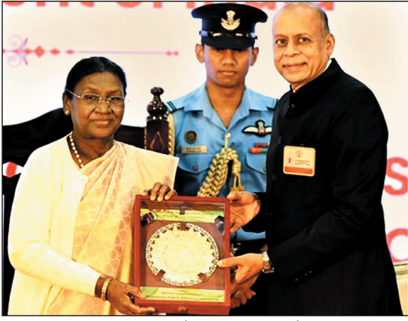
प्रमुखों को एक साथ लाता है। सेवा आयोगों के योगदान का उल्लेख राष्ट्रपति ने केन्द्रीय और राज्य लोक भी किया।

राष्ट्रपति ने लोक सेवा आयोगों के राष्ट्रीय सम्मेलन के उद्घाटन सत्र को किया संबोधित