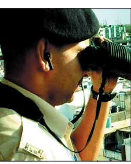
होना शेष है, लेकिन प्रशासनिक स्तर पर तैयारियां तेज कर दी गई हैं। जानकारी के अनुसार केंद्रीय गृह मंत्री वायुसेना के विशेष विमान से ग्वालियर एयरबेस पर पहुंचेंगे और वहां से सोधे मेला मैदान में आयोजित

25 दिसंबर को प्रस्तावित इस वीआईपी दौरे के दौरान शहर में चाक चौबंद सुरक्षा व्यवस्था रहेगी और कई प्रमुख मार्गों पर यातायात डायवर्ट किया जाएगा। हालांकि, केंद्रीय गृह मंत्रालय से अभी औपचारिक कार्यक्रम जारी