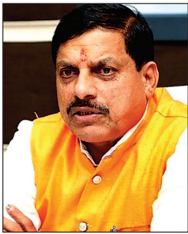
अब अस्थायी कर्मी कल्चर को पूरी तरह समाप्त कर दिया जाएगा। कैबिनेट ने मंगलवार को इस संबंध में पेश प्रस्ताव को हरी झंडी

प्रदेश में स्थायी और अस्थायी नौकरी के भेद को खत्म करने की तैयारी राज्य सरकार ने की है, जिसके तहत प्रदेश में केवल चुनिंदा पद ही अस्तित्व में रहेंगे। इनमें नियमित, सविदा, आउटसोर्स और अंशकालिक जैसे पद शामिल हैं। इस तरह प्रदेश में