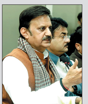
विभाग की दो वर्ष की उपलब्धियों का ब्यौरा उन्होंने पत्रकारों को दिया. इस दौरान उनसे जबलपुर के सरकारी अस्पताल के आईसीसीयू में चूहों के आतंक को लेकर सवाल पूछा गया था. इससे पहले भी इंदौर के एमवाय

उन्होंने कहा कि इंदौर के एमवाय अस्ताल की बिल्डिंग 70 वर्ष पुरानी है, वहां कई वर्षों से इस तरह की शिकायत सुन रहे थे, इसलिए ही अब वहां 773 करोड़ रुपये की लागत से नया भवन बनाया जाएगा। यह बात उन्होंने मंगलवार को एक सवाल के जवाब के दौरान कही. लोक स्वास्थ्य एवं चिकित्सा शिक्षा