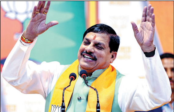
संतुलित नेतृत्व का संकेत

डॉ. मोहन यादव के दो वर्ष का कार्यकाल यह संकेत देता है कि सरकार अतीत के सांस्कृतिक गौरव, वर्तमान की प्रशासनिक प्राथमिकताओं और भविष्य की विकास योजनाओं—तीनों को एक साथ आगे बढ़ाने का प्रयास कर रही है। आने वाले समय में इन पहलों का वास्तविक असर प्रदेश की आर्थिक और सामाजिक परिस्थितियों में दिखाई देगा।