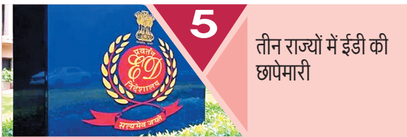
5 तीन राज्यों में ईडी की छापेमारी