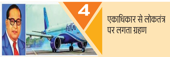
4 एकाधिकार से लोकतंत्र पर लगता ग्रहण