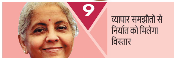
9 व्यापार समझौतों से निर्यात को मिलेगा विस्तार