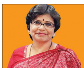
कि शिक्षित महिलाओं को उभरते क्षेत्रों में कहीं अधिक रोजगार

राठकर ने यहां फिक्की द्वारा आयोजित दूसरे कार्यबल में महिलाएं सम्मेलन में बताया कि प्रौद्योगिकी और कार्य व्यवस्था में लचीलापन महिलाओं के रोजगार के लिए अभूतपूर्व अवसर पैदा कर रही हैं। उन्होंने कहा, हम अनुमान लगाते हैं कि साल 2030 तक ई-कॉमर्स, ऑनलाइन सेवाओं, डिजिटल प्लेटफॉर्म और वर्क-फ्रॉम-होम के माध्यम से महिलाओं का डिजिटल रोजगार कम से कम तीन गुना बढ़ सकता है। उन्होंने कहा