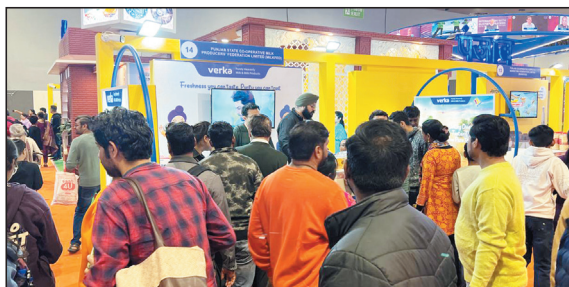
योग्य वेरका खीर और रबड़ी अपनी उच्च गुणवत्ता के चलते लोगों की गाढ़ी बनावट, शानदार स्वाद और पहली पसंद बनी हुई हैं.

नई दिल्ली, 27 नवंबर. भारत मंडपम, प्रगति मैदान में आयोजित भारत अंतर्राष्ट्रीय व्यापार मेला 2025 में वेरका द्वारा लगाया गया आकर्षक स्टॉल उपभोक्ताओं के लिए विशेष आकर्षण का केंद्र बना हुआ है. वेरका दिल्ली कार्यालय के प्रबंधन में लगाए गए इस स्टॉल पर कंपनी के प्रमुख डेयरी उत्पाद वेरका घी, वेरका खीर, वेरका रबड़ी, वेरका दही और वेरका लस्सी को आगंतुकों से अत्यधिक उत्साहजनक प्रतिक्रिया मिल रही है. स्टॉल पर पहुंचे आगंतुकों ने वेरका घी की शुद्धता और पारंपरिक स्वाद की प्रशंसा करते हुए कहा कि यह भारतीय पारंपरिक व्यंजन-निर्माण की असली पहचान को बनाए रखता है. वहीं, तैयार-खाने