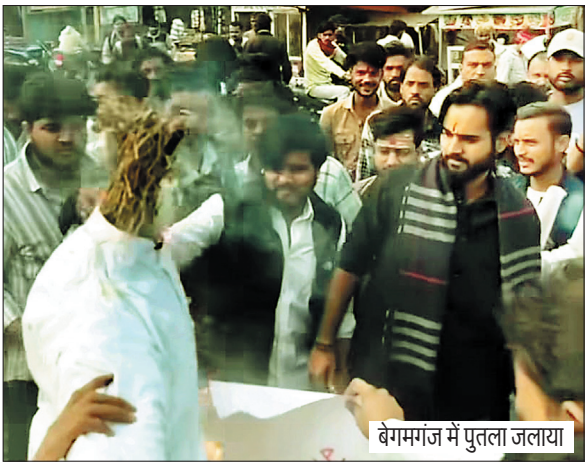
बेगमगंज में पुतला जलाया

गौहरगंज क्षेत्र में छह साल की मासूम से दुष्कर्म से लोगों में आक्रोश, बेगमगंज सहित कई जगहों पर प्रदर्शन