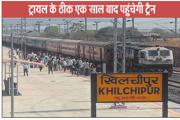
ट्रायल के ठीक एक साल बाद पहुंचेगी ट्रैन

नवभारत न्यूज ब्यावरा 21 नवंबर, का. दो दशक से जिस आवाज को सुनने के लिए जिलेवासी इंतजार कर रहे थे वो बमुश्किल दो महीने बाद पूरा होने वाला है. एक समय में काफी विलम्ब से चलने वाले रामगंजमण्डी-भोपाल रेल परियोजना अब स्पीड पकड़ रही है और टाईम कवर करते हुए अपने गंतव्य तक पहुंचने वाली है. बीते दिनों घाटोली से खिलचीपुर तक का ट्रैक तैयार हो चुका था, उस पर ट्रायल पर हुआ था, लेकिन ट्रैक के नियमित चलने पर संशय था. अब पश्चिम मध्य रेलवे ने हरी झण्डा दिखाते हुए जितना ट्रैक तैयार है उस पर ट्रैन चलाने का सहमति दे दी है. यानी खिलचीपुर तक आगामी जनवरी 2026 में नियमित रूप से ट्रैन का संचालन होने जा रहा है.