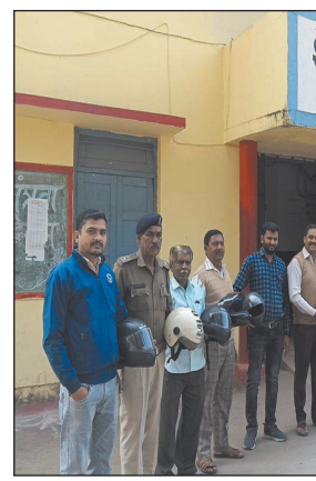
जिला सहकारी केन्द्रीय बैंक द्वारा 72वाँ अभा सप्ताह आयोजित