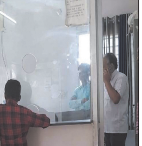
नवभारत न्यूज ब्यावरा 21 नवंबर, का. स्थानीय शहीद कॉलोनी स्थित विद्युत वितरण कंपनी के कार्यालय में बीते पांच दिनों से

तकनीकी कारणों के चलते उपभोक्ताओं के बिजली बिल जमा नहीं हो पा रहे थे जिसके कारण परेशानी का सामना करना पड़ रहा था. आखिरकार