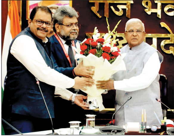
बकरतउल्लाह विश्वविद्यालय भोपाल के डिजिटल डिग्री वेरिफिकेशन पोर्टल का वन क्लिक से शुभारंभ किया। कार्यक्रम का आयोजन राजभवन में किया गया था।

नवभारत प्रतिनिधि भोपाल, 20 नवंबर. राज्यपाल मंगुभाई पटेल ने कहा है कि डिजिटल डिग्री वेरिफिकेशन पोर्टल उच्च शिक्षा की बेहतर तरीके की दिशा में ऐतिहासिक कदम है। पोर्टल, विद्यार्थी हित की सार्थक पहल है। उन्होंने कहा कि विश्वविद्यालय के शैक्षणिक गतिविधियों में तकनीकी नवाचार से विद्यार्थियों को वेरिफिकेशन की जटिल प्रक्रिया से राहत मिलेगी। रोजगार और प्लेसमेंट आदि जरूरी प्रक्रियाएं सुरक्षित रूप में सरलता और शीघ्रता से हो सकेंगी। उन्होंने पोर्टल के माध्यम से डिग्री वेरिफिकेशन प्रक्रिया को समझा। स्वयं रैंडम परीक्षण किया। राज्यपाल पटेल ने गुरुवार को