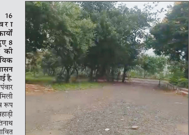
अत्यंत उपयोगी सिद्ध होगा. राज्यमंत्री श्री पंवार ने इस मंजूरी पर प्रधानमंत्री नरेंद्र मोदी और मुख्यमंत्री डॉ. मोहन यादव के नेतृत्व का आभार माना है. 8 करोड़ 57 लाख रुपए लागत के 35 सामुदायिक भवनों की स्वीकृति, विशेष रूप से घुरेल पहाड़ी स्थित ज्योतिर्लिंग पशुपतिनाथ मंदिर में सामुदायिक भवन की मंजूरी, क्षेत्र जनता के लिए एक बड़ी सौगत है. जहां भवन श्रद्धालुओं, सामाजिक संगठनों और स्थानीय नागरिकों के लिए एक सशक्त सुविधा केंद्र सिद्ध होगा.

व्यावरा/राजगढ़, 16 नवंबर, का. ब्यावरा 1 विधानसभा में विकास कार्यों को एक नई गति देते हुए 8 करोड़ 57 लाख रुपए की लागत से 35 सामुदायिक भवनों के निर्माण को शासन द्वारा स्वीकृति प्रदान की गई है. राज्यमंत्री नारायण सिंह पंवार के प्रयासों से यह सौगत मिली है. इन स्वीकृतियों में विशेष रूप से पवित्र तीर्थ स्थल घुरेल पहाड़ी स्थित ज्योतिर्लिंग पशुपतिनाथ मंदिर परिसर में प्रस्तावित सामुदायिक भवन शामिल है, जो धार्मिक, सामाजिक और सांस्कृतिक गतिविधियों के लिए