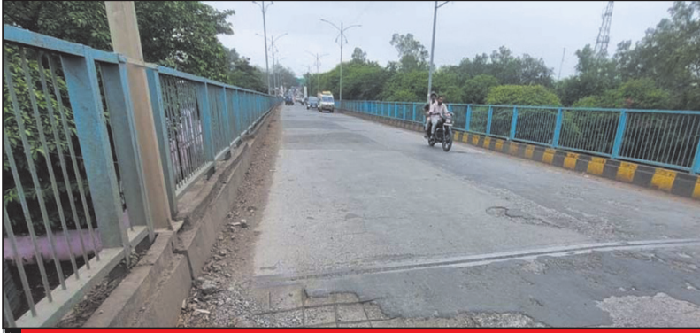
रोजाना हजारों छोटे- बड़े वाहनों की आवाजाही

शहर को पहले ओवरब्रिज की शुरुआत मंडी में मिली थी. लगभग 14 करोड़ रुपये की लागत से तैयार हुए इस ब्रिज के निर्माण के दौरान भी खतरनाक मोड़ को लेकर स्थानीय रहवासियों द्वारा खासा विरोध दर्ज कराया गया था. इतना ही नहीं डेढ़ साल में तैयार होने वाला छह साल में बनकर तैयार हो पाया था. इस दौरान निर्माण में बरती गई लापरवाही और विलंब के अलावा गुणवत्ता को लेकर भी सवाल उठे थे. वर्ष 2020 में कमलनाथ सरकार के शासनकाल में पूर्व मंत्री सज्जन सिंह वर्मा द्वारा इसका उद्घाटन किया था. इस ब्रिज पर आवाजाही शुरू होने से नागरिकों को रेलवे क्रासिंग पर खड़े होने की झंझट से छुटकारा तो मिल गया था, लेकिन कुछ ही दिन बाद ब्रिज निर्माण में बरती गई अनियमितताएं उजागर होने लगीं. ब्रिज की सतह से सीमेंट और गिट्टी