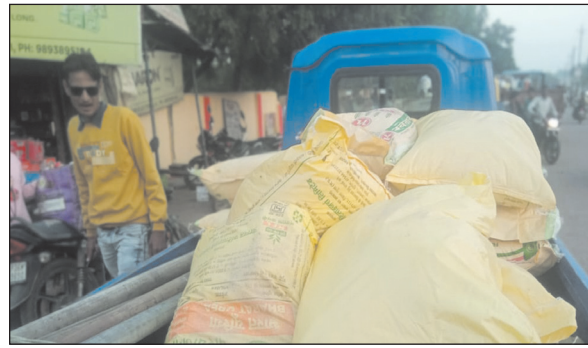
जांच के नाम पर महज खानापूर्ति

खरगापुर नगर के दुकानदार कर रहे कालाबाजारी