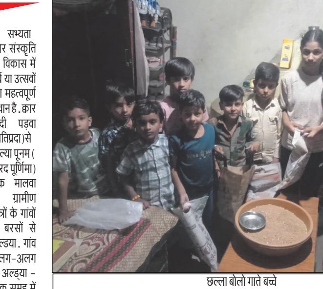
छल्ला बोलो गाते बच्चे

बताना असंभव है. छल्ला एक लोकगीत शैली है. कहते हैं, यह गीत एक नाविक के बेटे की कहानी है, जो दुर्भाग्य से एक दिन नदी में डूब जाता है. यह गीत छल्ले के अपने इकलौते बेटे छल्ला को खोने के दुःख को बयां करता है. इस गीत को कई गायकों ने गाया है. इसमें पीढ़ी दर पीढ़ी बच्चों की सहभागिता बनी हुई है. गावों की संस्कृति और परंपराओं में बसती है भारतीय संस्कारों की आत्मा. आधुनिकीकरण और तकनीकी क्रांति ने नगरीय संस्कृति के बहाने पाश्चात्य संस्कृति को दबे पाँव देने में परंपराओं का मौका दिया है. इसके बाद भी ग्रामीण अंचलों में आज भी परंपराओं के नाम पर कई संदेश और शिक्षा बची है. त्योहारों के देश भारत में हर 5-50 कोस की दूरी पर परंपराओं का स्वल्प, खानपान, रहन-सहन, वेशभूषा, बोलचाल और बोली भी बहुत कुछ बदली-बदली सी नजर आती है. शाम होते ही गीत गाते हुए