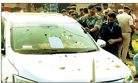
असांजिक तत्वों ने उनकी पार्टी भाजपा के एजेंट को बूथ से जबरन हटा दिया। उन्होंने आरोप लगाया कि राजद

लखीसराय, 06 नवंबर (वार्ता) बिहार के उप मुख्यमंत्री और लखीसराय विधानसभा क्षेत्र से भारतीय जनता पार्टी (भाजपा) के उम्मीदवार विजय कुमार सिन्हा ने आरोप लगाया कि उनके विधानसभा क्षेत्र में उन पर राष्ट्रीय जनता दल (राजद) समर्थित असांजिक तत्वों ने उनकी गाड़ी पर पथराव किया। सिन्हा ने यहां पत्रकारों से बातचीत में कहा कि उन्हें जानकारी मिली थी कि लखीसराय विधानसभा क्षेत्र के खुरियार इलाके में बूथ नंबर 405 पर राजद समर्थित असांजिक तत्व कब्जा किए हुए हैं। उन्होंने कहा कि