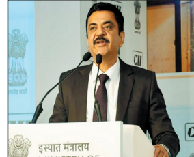
ऑटोमोटिव और बिजली जैसे क्षेत्रों से बढ़ती मांग के कारण इस्पात उद्योग में निवेश के व्यापक