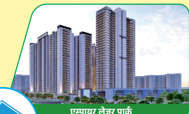
एस्पायर लेज़र पार्क