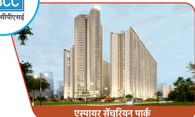
एस्पायर सेंचुरियन पार्क