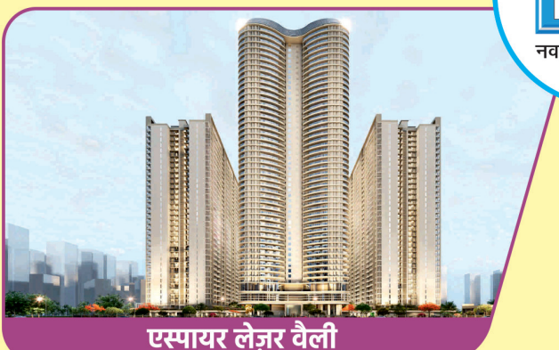
एस्पायर लेज़र वैली