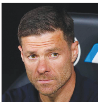
विलारियल के बीच 20 दिसंबर, 2025 को होने वाला अवे गेम संयुक्त राज्य अमेरिका में खेला जाएगा। यह किसी यूरोपीय शीर्ष-स्तरिय लीग का विदेश में आयोजित होने वाला पहला मुकाबला होगा।

ला लीगा मियामी मैच विवाद यह फैसला प्रतिस्पर्धा को विकृत करता है: कोच एम्बाप्पे खेलने के लिए फिट