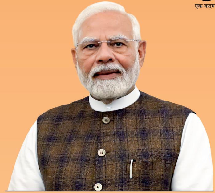
नरेन्द्र मोदी, प्रधानमंत्री