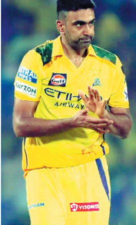
सिडनी थंडर से जुड़ेंगे, 14 दिसंबर से शुरू होगा टूर्नामेंट संन्यास के बाद अश्विन को विदेशी लीग में खेलने की पिली टूट

सिडनी, 24 सितम्बर. अनुभवी ऑफ स्पिनर रविचंद्रन अश्विन ऑस्ट्रेलिया की मशहूर बिग बैश लीग (बीबीएल) के आगामी सत्र में सिडनी थंडर के साथ जुड़ेंगे. इसके साथ ही, वह इस प्रतिष्ठित टी20 टूर्नामेंट में हिस्सा लेने वाले पहले बड़े भारतीय क्रिकेटर बन जाएंगे. रिपोर्ट के अनुसार, 39 वर्षीय अश्विन, जिन्होंने हाल ही में अंतरराष्ट्रीय क्रिकेट और इंडियन प्रीमियर लीग से संन्यास लिया है, दिसंबर से 18 जनवरी तक चलेगी, और आईएलटी20 लीग के 4 जनवरी को खत्म होने के बाद अश्विन सिडनी थंडर से जुड़ सकते हैं. क्रिकेट ऑस्ट्रेलिया के सीईओ टॉड ग्रीनबर्ग ने खुद इस महीने अश्विन से संपर्क कर बीबीएल में उनकी भागीदारी पर चर्चा की थी. बीसीसीआई के नियमों के अनुसार, सक्रिय भारतीय खिलाड़ी विदेशी लीग में नहीं खेल सकते, जब तक कि वह राष्ट्रीय टीम या आईपीएल टीम से जुड़े हों. सिडनी थंडर से जुड़ेंगे, 14 दिसंबर से शुरू होगा टूर्नामेंट संन्यास के बाद अश्विन को विदेशी लीग में खेलने की पिली टूट ने सिडनी थंडर के साथ खेलने पर सहमति दे दी है. फ्रेंचाइजी इस हफ्ते के आखिर तक इस खबर की आधिकारिक घोषणा कर सकती है. अश्विन फिलहाल आईएलटी20 की नीलामी में भी शामिल हैं. बिग बैश लीग 14