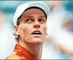
बदलावों का खुलासा नहीं किया. सिनर का मानना है कि इन बदलावों की वजह से शुरुआत में कुछ गलतियां हो सकती हैं. उन्होंने कहा, फिलहाल गलतियों की संख्या थोड़ी ज्यादा है, लेकिन मुझे उम्मीद है कि इसका परिणाम बहुत सकारात्मक होगा. सिनर, जिन्होंने पिछले साल चाइना ओपन के फाइनल में अल्काराज से हार का सामना किया था, गुरुवार को क्रोएशिया के मारिन सिलिच के खिलाफ अपने खिलाफ को रक्षा करने की कोशिश करेंगे.

किसी भी खिलाड़ी को भारतीय दल में तभी जगह मिलेगी जब उसने आगामी एशियाई खेलों से 12 महीने पहले आयोजित किसी अंतरराष्ट्रीय प्रतियोगिता में पिछले एशियाई खेलों के छठे स्थान के प्रदर्शन के बराबर या उससे बेहतर प्रदर्शन किया हो. यदि खेल पिछले एशियाई खेलों में शामिल नहीं था, तो चयन मानदंड आगामी एशियाई खेलों से 12 महीने पहले आयोजित सीनियर एशियाई चैंपियनशिप के समान मानकों पर आधारित होंगे. खेल प्राधिकरण के विश्लेषकों की राय के आधार पर उचित कारणों से किसी खिलाड़ी या टीम की भागीदारी की सिफारिश की जाती है. बोर्जिंग, 24 सितम्बर. यूएस ओपन फाइनल में कार्लोस अल्काराज से हारने के बाद, इतालवी टेनिस खिलाड़ी जैकिक सिनर ने अपने खेल में कई बदलाव किए हैं. 24 साल के सिनर, जो अब विश्व में दूसरे नंबर के खिलाड़ी हैं, ने कहा कि वह इस हार के बाद से अपने खेल में लगातार सुधार कर रहे हैं. यूएस ओपन फाइनल में अल्काराज के हाथों हारने के बाद सिनर ने स्वीकार किया था कि अपने प्रतिद्वंद्वी को हराने के लिए उन्हें अपने खेल को और अधिक अप्रत्याशित बनाना होगा. बोर्जिंग में चाइना ओपन से पहले, सिनर ने कहा, हमने बहुत कुछ सोचा है. उन्होंने यह भी बताया कि वह अपने खेल में कई छोटी-मोटी चीजें बदल रहे हैं, हालांकि उन्होंने इन बदलावों का खुलासा नहीं किया. सिनर का मानना है कि इन बदलावों की वजह से शुरुआत में कुछ गलतियां हो सकती हैं. उन्होंने कहा, फिलहाल गलतियों की संख्या थोड़ी ज्यादा है, लेकिन मुझे उम्मीद है कि इसका परिणाम बहुत सकारात्मक होगा. सिनर, जिन्होंने पिछले साल चाइना ओपन के फाइनल में अल्काराज से हार का सामना किया था, गुरुवार को क्रोएशिया के मारिन सिलिच के खिलाफ अपने खिलाफ को रक्षा करने की कोशिश करेंगे.