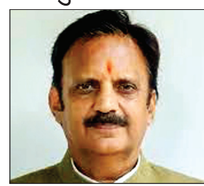
गतिविधियों के अभिसरण और समन्वय से संचालित हो रहा है.

भोपाल , 24 सितम्बर. 'स्वस्थ नारी सशक्त परिवार' अभियान के अंतर्गत आज सरोजनी नायडू शासकीय स्वशासी कन्या (नूतन) महाविद्यालय, शिवाजी नगर, भोपाल में विशेष स्वास्थ्य परीक्षण एवं जागरूकता शिविर का आयोजन किया जाएगा. इस शिविर का उद्घाटन उप मुख्यमंत्री राजेन्द्र शुक्ल करेंगे. अभियान का शुभारंभ माननीय प्रधानमंत्री नरेन्द्र मोदी द्वारा 17 सितम्बर 2025 को धार जिले के भैसोला ग्राम से किया गया था, जो 02 अक्टूबर 2025 तक जारी रहेगा. यह अभियान महिला एवं बाल विकास विभाग द्वारा आयोजित पोषण माह की