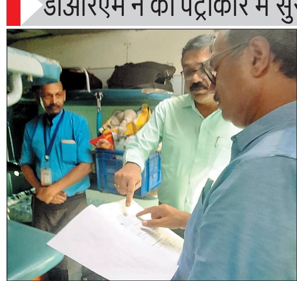
डीआरएम ने की पेंट्रीकार में सुरक्षा उपकरणों एवं वेंडरों की जांच

दीपावली से पहले सर्विस रोड का डामरीकरण और मरम्मत का कार्य पूरा कर लिया जाएगा. वहीं आगामी 10 दिनों में पूरे मार्ग पर लाइट भी लगा दी जाएगी. मंत्री सिलावट ने कहा कि निर्माण कार्य के दौरान यातायात बाधित न हो, इसके लिए एनएचआई स्थानीय प्रशासन और पुलिस के साथ समन्वय करते हुए मार्शलस की संख्या भी बढ़ाए. उल्लेखनीय है कि वर्तमान में झलारिया से अर्जुन बरोदा मार्ग की सर्विस रोड बुरी तरह क्षतिग्रस्त हो चुकी है, जिसके कारण प्रतिदिन लंबे जाम की स्थिति बन रही है.