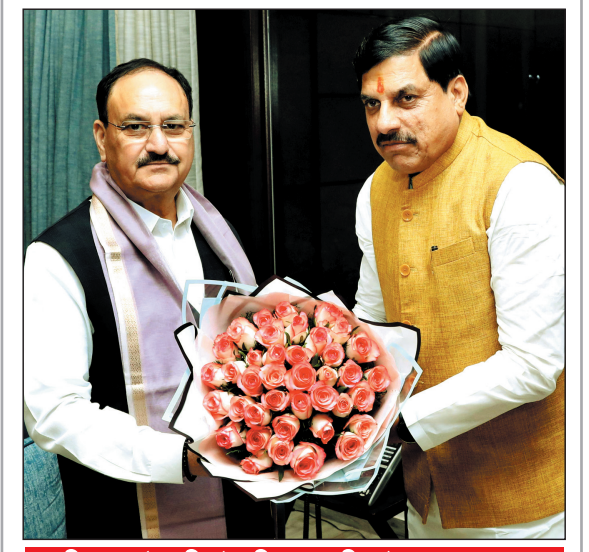
सीएम ने की केंद्रीय मंत्री से मुलाकात