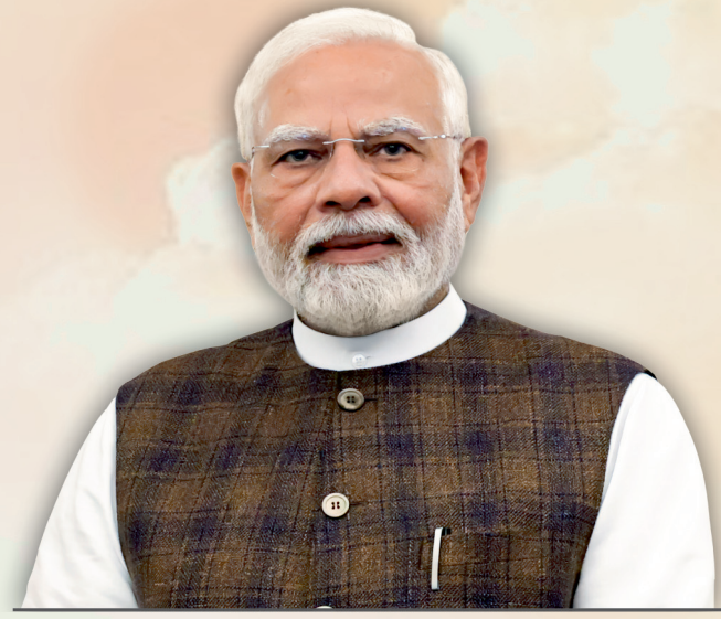
नरेन्द्र मोदी, प्रधानमंत्री