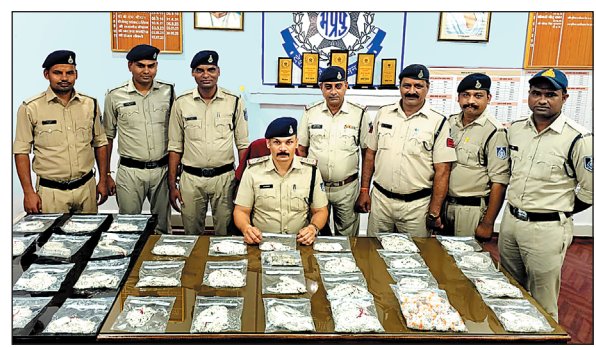
पुलिस को देख बैग छोड़कर भागा था बदमाश

जीआरपी की टीम में मुखबिर से मिली सूचना के आधार पर एक बैग से लगभग 15 किलो चांदी जब्त की जिसकी कीमत 20 लाख रुपए बताई जा रही है. हालांकि पुलिस को देखकर बदमाश देख छोड़कर भाग गया. मामले में पुलिस ने फिलहाल प्रकरण दर्ज कर जांच शुरू. त्योहारों को देखते हुए वरिष्ठ अधिकारियों के निर्देशानुसार जीआरपी द्वारा रेलवे