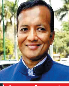
विस्तार की वजह से उत्पादन में वृद्धि

जिंदल स्टील का कच्चा इस्पात उत्पादन बढ़ेगा 50 प्रतिशत वर्ष-दर-वर्ष 50 वृद्धि की संभावना