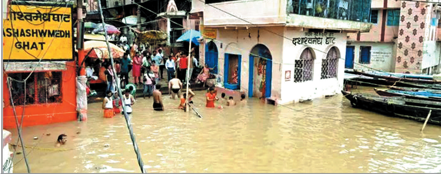
प्रयागराज में शमशान और कब्रिस्तान में पहुंचा बाढ़ का पानी

यह जानकारी एक अनौपचारिक कैबिनेट बैठक के बाद मीडियाकर्मियों से बातचीत के दौरान दी। उन्होंने सभी मंत्रियों, विधायकों और समर्थित विधायकों से एक महीने की तयखाह मुख्यमंत्री नयब सिंह सेनी राहत कोष में दान करने की अपील की, ताकि बचाव और पुनर्वास कार्यों को गति मिले और प्रभावित परिवारों को तत्काल राहत प्रदान की जा सके।