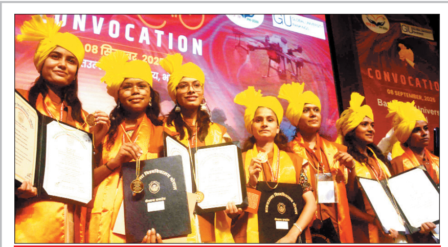
उपाधि पाकर खुश हुए विद्यार्थी

नवभारत प्रतिनिधि भोपाल, 8 सितंबर. जवाहर नवोदय विद्यालय प्रवेश परीक्षा 2026 के कक्षा नवमी एवं ग्यारहवीं में प्रवेश के लिए आवेदन प्रक्रिया प्रारंभ हो चुकी है। यह पूरी प्रक्रिया ऑनलाइन माध्यम से की जाएगी। प्रवेश के लिए छात्र-छात्राओं का शासकीय-अशासकीय मान्यता प्राप्त विद्यालय मंथ सत्र 2025-26 में कक्षा आठवीं और दसवीं कक्षा अध्ययनरत होना आवश्यक है। प्रवेश के बाद छात्र-छात्राओं को शिक्षा आवास भोजन यूनिफार्म पाठ्य-पुस्तकें एवं दैनिक उपयोग की वस्तुएं निःशुल्क दी जाएंगी।