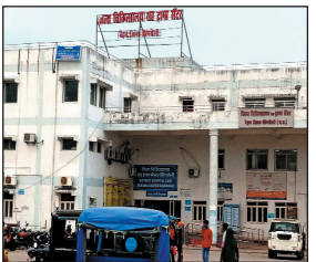
पैमाने पर अनियमितता और बंदरबांट की चर्चाएं जोर-शोर से चल रही हैं. आरोप है कि यहाँ पर इलेक्ट्रॉनिक कलेक्टर ने डीजल खर्च पर सीएमएचओ को दिए निर्देशसमेत कई सामग्रियां बिना टेंडर के ही खरीदी गई हैं. सेवानिवृत्त सिविल सर्जन के कार्यकाल में उनके एक खास ऑपरेटर पर राशि की बंदरबांट करने का संदेह जताया जा रहा है.

सिंगरौली 8 सितंबर. जिला चिकित्सालय सह ट्रामा सेंटर में वर्ष 2023 से लेकर अब तक रोगी कल्याण समिति से खर्च की गई राशि और खरीदी गई सामग्रियों में हुई अनियमितताओं का मामला अब तूल पकड़ रहा है. आम आदमी पार्टी के जिलाध्यक्ष ने इसकी उच्च-स्तरीय जांच की मांग की है. वहीं, डीजल खर्च के मामले में कलेक्टर ने सीएमएचओ को जांच करने का निर्देश दिया है, हालांकि इस मामले में सीएमएचओ जवाब देने से बच रहे हैं. यह जानकारी मिली है कि जिला चिकित्सालय में पिछले दो वर्षों के दौरान रोगी कल्याण समिति की राशि में बड़े