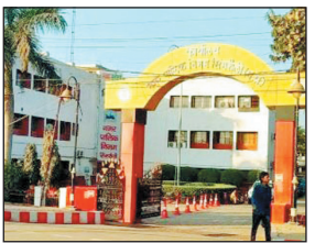
की वसूली की जाएगी. उपायुक्त बैस ने जिन कंपनियों को नोटिस जारी किया है, उनमें डीबीएल कंपनी पर 4 लाख 25 हजार 455 रुपये, सिक्कल लांजिस्टिक्स पर 8 लाख 72 हजार 328 रुपये, कलिंगा कॉमर्शियल कॉर्पोरेशन लिमिटेड पर 2 लाख 67 हजार 236 रुपये, वीपीआर कंपनी पर 6 लाख 11 हजार 955 रुपये, भारत अर्थ मूवर्स लिमिटेड पर 3 लाख 39 हजार 509 रुपये, राम कृपाल

उपायुक्त ने कहा कि यदि कंपनियां निर्धारित समयवधि में निगम के अंदा का भुगतान नहीं करती हैं, तो उनकी चल-अचल संपत्ति को कुर्क कर बकाया राशि