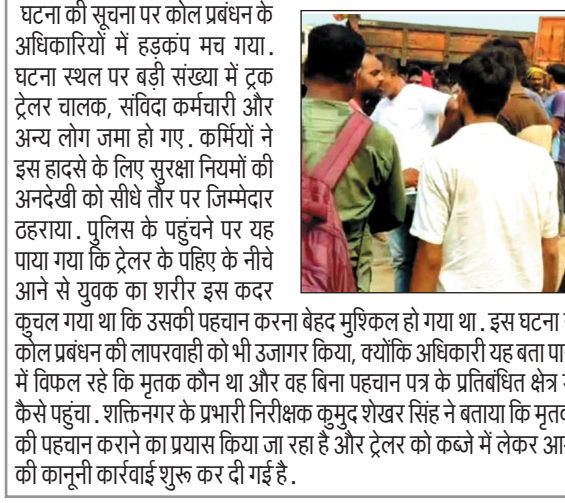
स्थित कोल डिस्पेंस बैरियर के पास हुआ, जहाँ ट्रक ट्रेलरों का पार्किंग स्थल है. बताया जा रहा है कि एक ट्रेलर चालक अपने वाहन को पीछे कर रहा था, इसी दौरान लगभग 22 वर्षीय युवक उसकी चपेट में आ गया और मौके पर ही उसकी मौत हो गई.

शव को एनटीपीसी शक्तिनगर के संजीवनी चिकित्सालय के शवगृह में रखा दिया गया है. हादसा दुर्घटना कोयला खदान क्षेत्र में