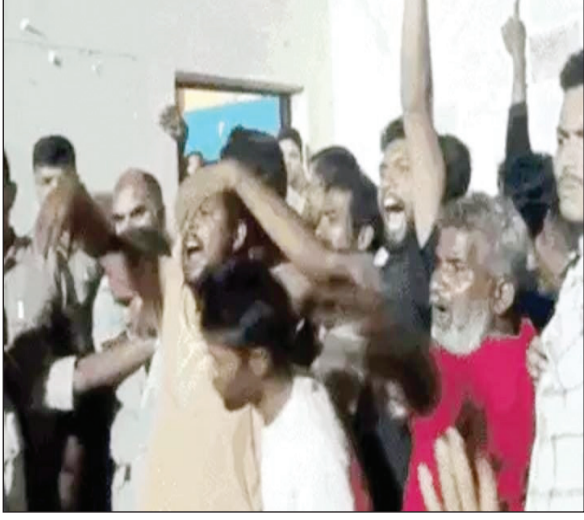
व्यवस्था बिगड़ गई. कर्मचारी वितरण संभालने में नाकाम रहे.