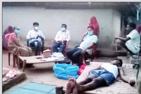
में कुल 22 लोग संक्रमित हो गए. 20 लोगों को प्राथमिक स्वास्थ्य केंद्र टमसार में भर्ती कराया गया, जहां प्राथमिक उपचार के बाद वे

4 सितंबर को जहां 1 व्यक्ति इस बीमारी की चपेट में आया, वहीं दूसरे दिन 5 सितंबर को 4, तीसरे दिन 6 सितंबर को 5 और 7 सितंबर को एक साथ 8 लोग संक्रमित हुए, 8 सितंबर को 4 और मरीज मिले, जिससे 3 दिनों