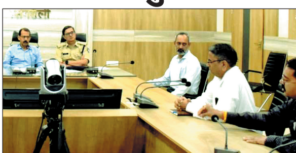
की गई. बैठक में सड़क सुरक्षा निधि के संबंध में चर्चा की गई और यह निर्णय लिया गया कि एमएसएमई मद बनाकर राशि जमा कराई जाए, ताकि आकस्मिक घटनाओं सहित अन्य स्थितियों में संबंधित व्यक्तियों को राहत राशि प्रदान की जा सके.

इस बैठक में सड़क दुर्घटनाओं पर नियंत्रण पाने के तरीकों पर विशेष रूप से चर्चा कर समीक्षा