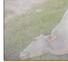
नवभारत न्यूज बुधनी 3 सितंबर. थाना क्षेत्र अंतर्गत ग्राम पीलीकरार में बीती रात खेत की फेंसिंग में प्रवाहित करंट लगने से एक गाय की मौत हो गई. गाय मालिक ने बुधनी

पूर्व में भी हो चुके ऐसे हादसों पर रोक लगाने की मांग