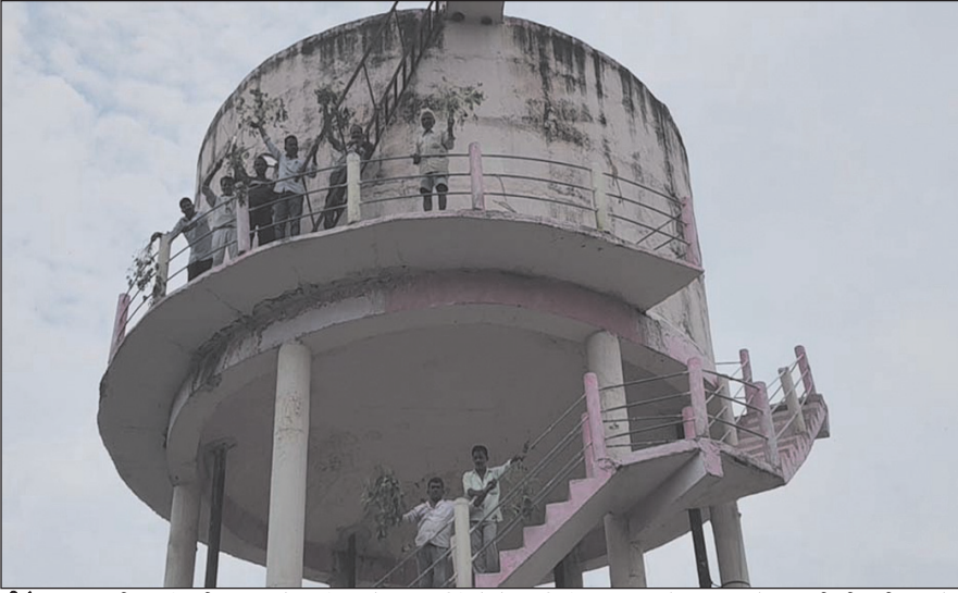
सीहोर. फसल बीमा राशि की मांग करते हुए किसानों द्वारा कई दिनों से प्रदर्शन किया जा रहा है. बुधवार को वह पानी की टंकी पर चढ़े.

बीते कई दिनों से अजीब ढंग से प्रदर्शन कर रहे किसानों का कहना है कि वह पांच साल से खराब फसल की बीमा राशि का इंतजार कर रहे हैं, लेकिन उन्हें बीमा राशि नहीं मिल सकी है. ऐसे में उनके सब्र का बांध ढह गया है और वह बीते 11 दिन से क्रमबद्ध ढंग से प्रदर्शन कर रहे हैं. अब तक किसानों ने खेतों में धरना, जल सत्याग्रह और पेड़ों पर चढ़कर घंटी बजाते हुए प्रदर्शन किया है. इसके अलावा कलेक्ट्रेट में भी खराब फसल के साथ पहुंचकर