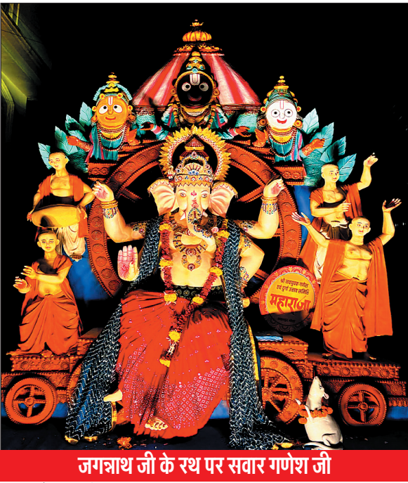
जगन्नाथ जी के रथ पर सवार गणेश जी

भोपाल, 2 सितंबर. श्री नवयुवक गणेश एवं दुर्गा उत्सव समिति पुराना कबाड़खाना भोपाल द्वारा भगवान जगन्नाथ जी के रथ पर सवार गणेश जी की आकर्षक प्रतिमा विराजमान की है.