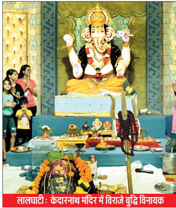
लालघाटी: केदारनाथ मंदिर में विराजे बुद्धि विनायक

भोपाल. पुराने शहर में जुमेराती के दयानंद चौक पर श्री सार्वजनिक गणेश उत्सव समिति द्वारा भगवान गणेशजी की आकर्षक प्रतिमा विराजमान की गई है, यहां प्रतिदिन बड़ी संख्या में श्रद्धालु भगवान के दर्शन करने पहुंच रहे हैं.