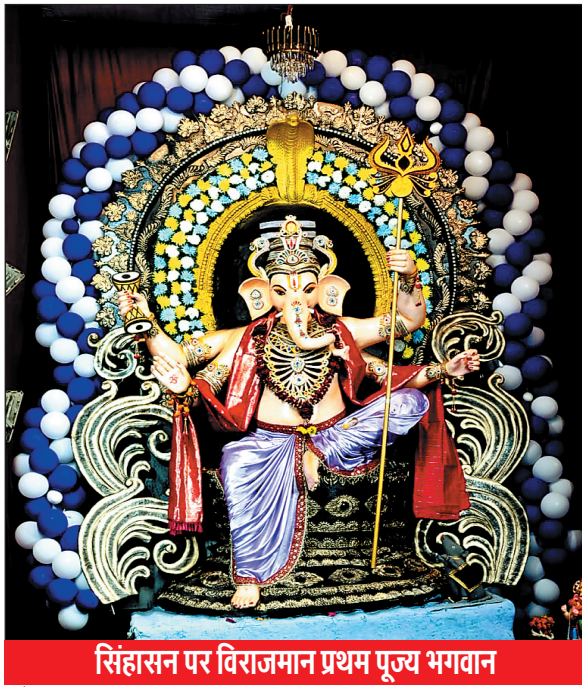
सिंहासन पर विराजमान प्रथम पूज्य भगवान

भोपाल, 2 सितंबर. श्री नवयुवक गणेश एवं दुर्गा उत्सव समिति पुराना कबाड़खाना भोपाल द्वारा भगवान जगन्नाथ जी के रथ पर सवार गणेश जी की आकर्षक प्रतिमा विराजमान की है.