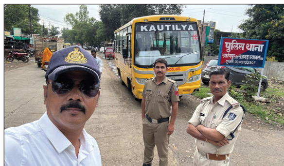
की गई एवं दस्तावेज चेक किए गए एवं जरूरी हिदायत दी गई.