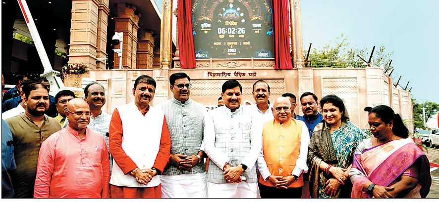
पंचांग, तिथि, नक्षत्र, योग, करण, वार, मास, व्रत एवं त्यौहारों की

यह भारत की सांस्कृतिक धुरी बनकर वैश्विक भाषाओं, परंपराओं, आस्था और धार्मिक कार्यों को जोड़ने वाली महत्वपूर्ण कड़ी बनेगी। विक्रमादित्य वैदिक घड़ी के तैयार किये गये मोबाइल ऐप में 3179 विक्रम पूर्व, महाभारतकाल से लेकर 7 हजार से अधिक वर्षों के