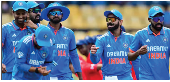
टीम इंडिया की टाइटल स्पॉन्सर बनीं, खूब सारा मुनाफा भी कमाया, लेकिन आगे चलकर डूबने की कगार पर आ पहुंचीं.

का नाम जुड़ गया है. दरअसल नए ऑनलाइन गेमिंग बिल की मार ड्रीम 11 पर भी पड़ी है. नया ऑनलाइन गेमिंग बिल पहले ही राज्यसभा में पास हो चुका है. राष्ट्रपति से मंजूरी के बाद यह नए कानून में बदल जाएगा. बस उसी के बाद ड्रीम11 को भारत से बोरिया-बिस्तर समेटना पड़ेगा. मगर इससे पहले सहारा, ओप्यो समेत कई सारी कंपनी