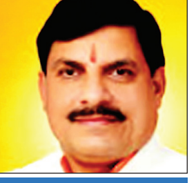
सीएम ने ड्रग तस्करो सहित अपराधियों को दी कड़ी चेतावनी

प्रशासनिक संवाददाता भोपाल, 13 अगस्त. राजधानी भोपाल में मछली परिवार के अवैध ड्रग्स कारोबार और लव-जिहाद के मामले सामने आने के बाद मुख्यमंत्री डॉ. मोहन यादव ने भोपाल पुलिस की पीठ-थपथपवाई है. वहाँ ड्रग्स तस्करो सहित दूसरे अपराधियों को भी कड़ी चेतावनी दी है. उन्होंने कहा कि हमने ढूँढ-ढूँढ कर कार्रवाई की है. भोपाल पुलिस ने नशे के अवैध कारोबार में लिप्त आरोपियों के खिलाफ दोस कार्रवाई की है. कोई कितना भी पहुंच वाला क्यों न हो, कोई भी मास्टरमाइंड हो, हम उसे छोड़ेंगे नहीं, आगे भी ऐसी कार्रवाई जारी रहेगी. हालांकि मुख्यमंत्री ने किसी का नाम नहीं लिया. मुख्यमंत्री डॉ. यादव ने बुधवार को रविवर भवन स्थित हंसध्वनि सभागार में नशा मुक्त