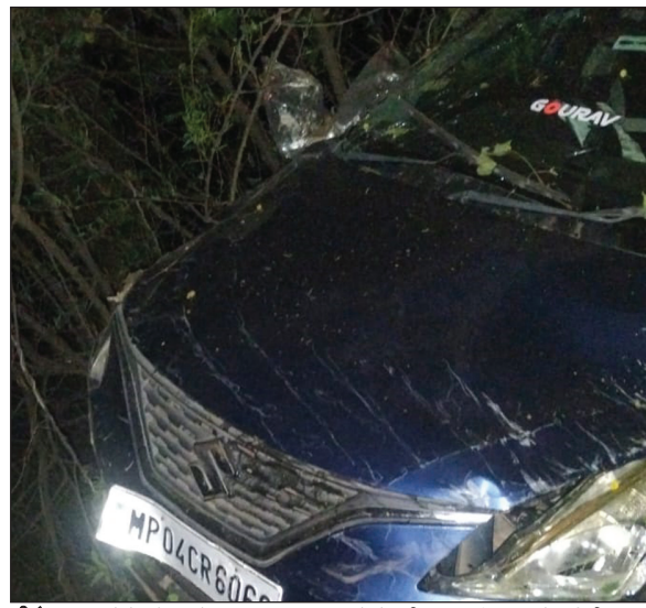
सीहोर. हादसे के दौरान तेज रफ्तार कार पलटने से पूरी तरह क्षतिग्रस्त हो गई थी.

जिले में हादसों का कहर धमने का नाम नहीं ले रहा है. अब फिर से दो जगह हुए दो हादसों में दो की मौत हो गई, जबकि तीन घायल हैं. पहला हादसा शुक्रवार रात 9.30 बजे भोपाल-इंदौर हाईवे बायपास स्थित सीहोर नगर पालिका के ट्रॉचिंग ग्राउंड के पास