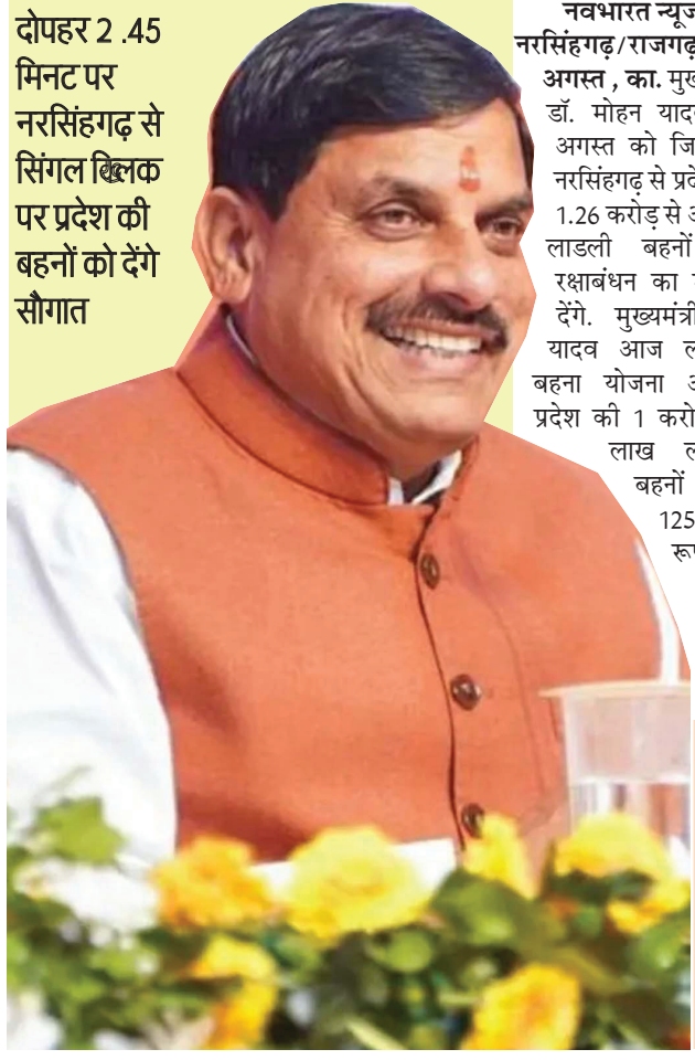
दोपहर 2.45 मिनट पर नरसिंहगढ़ से सिंगल खिलाक पर प्रदेश की बहनों को देगे सौगात

नवभारत न्यूज नरसिंहगढ़/राजगढ़ 06 अगस्त, का. मुख्यमंत्री डॉ. मोहन यादव 07 अगस्त को जिले के नरसिंहगढ़ से प्रदेश की 1.26 करोड़ से अधिक लाइली बहनों को रक्षाबंधन का उपहार देंगे. मुख्यमंत्री डॉ. यादव आज लाइली बहना योजना अंतर्गत प्रदेश की 1 करोड़ 26 लाख लाइली बहनों को 1250 रुपये व रक्षाबंधन के शगुन के रूप में प्रत्येक बहन को 250 रुपये की शगुन की अतिरिक्त राशि कुल 1800 करोड़ रुपये की राशि सिंगल खिलाक के माध्यम से बहनों के खातों में अंतरित करेंगे. राजगढ़ जिले की 2 लाख 95 हजार बहनों को 44 करोड़ रुपये से अधिक की राशि अंतरित करेंगे. कार्यक्रम में नीति आयोग के अभियान अंतर्गत समापन समारोह एवं आकांक्षा हाट का शुभारंभ भी करेंगे. मण्डी प्रांगण में अपराह्न 2.45 बजे आयोजित कार्यक्रम के विशिष्ट अतिथि जिले के प्रभारी एवं सूक्ष्म, लघु और मध्यम उद्यम चैतन्य कुमार काश्यप, राज्य मंत्री (स्वतंत्र प्रभार) मधुआ कल्याण एवं मत्स्य विकास विभाग नारायण सिंह पंचार, राज्य मंत्री (स्वतंत्र प्रभार) कौशल विकास एवं रोजगार विभाग गौतम डेटवाल, सांसद रोडमल नागर, मध्यप्रदेश जन अभियान परिषद उपाध्यक्ष मोहन नागर, जिला पंचायत अध्यक्ष चन्द्र सिंह साँधिया,