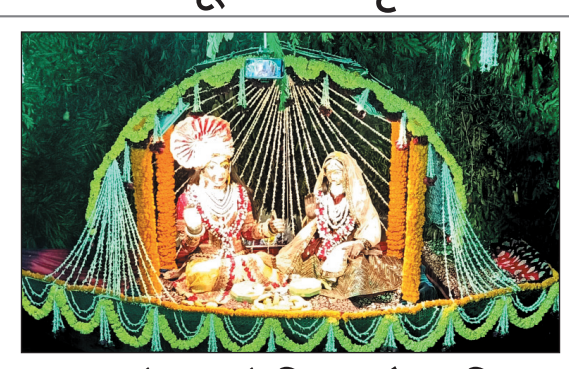
बाबा बटेश्वर ने किया नौका विहार