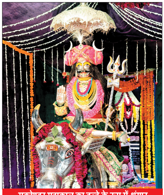
मुक्तेश्वर महाकाल का दूहे के रूप में श्रृंगार

भोपाल, 4 अगस्त. छोला विश्रामघाट स्थित मुक्तेश्वर महाकाल मंदिर में भगवान मुक्तेश्वर महाकाल का दूहे रूप में श्रृंगार कर पूजा-अर्चना की गई. शाम 5 बजे राजाधिराज मुक्तेश्वर महाकाल की सवारी निकाली गई.