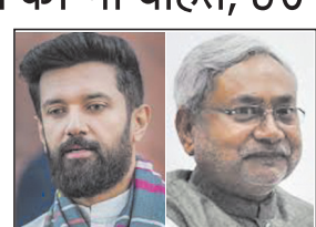
जद(यू) में 50-50 सीट शेयरिंग का फॉर्मूला बिगड़ता दिख रहा है. जहां नीतीश इस चुनाव में संतुलन खोज रहे हैं, तो भाजपा और चिराग ने अपने टारगेट बढ़ा कर दिया है. इस चुनाव में भाजपा और नीतीश के बीच चिराग की वाइल्ड कार्ड एंट्री हुई है, जो गेम-चेंजर साबित हो रहे हैं.

पटना. बिहार विधान चुनाव 2025 में चंद दिन ही बचे हैं. जैसे-जैसे चुनाव का समय नजदीक आ रहा है, राजनीतिक गठबंधन में खींचतान बढ़ने लगा है. बिहार सत्ताधारी एनडीए गठबंधन में बाहर से देखने में जैसा संतुलन दिख रहा है, उतना संतुलन ही नहीं है. चाहे भारतीय जनता पार्टी (भाजपा) हो या जद(यू) हो या फिर चिराग पासवान को लोक जनशक्ति पार्टी (एलजेपी-आर) हो. सीटों के लिए खींचतान शुरू हो चुका है. पहले के भाजपा और