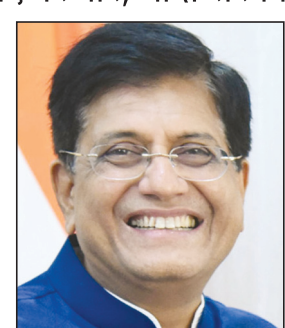
में प्रधानमंत्री नरेंद्र मोदी की सरकार आने के बाद राष्ट्रीय हित सर्वोपरि हो गया. पीएम मोदी

मुंबई, 27 जुलाई. वाणिज्य मंत्री पीयूष गोयल ने पिछली कांग्रेस के नेतृत्व वाली यूपीए सरकार पर निशाना साधते हुए आरोप लगाया कि उस दौरान हुए व्यापार समझौते देश के हित में नहीं थे. उन्होंने कहा कि कांग्रेस सरकार के दौरान ब्रिटेन भारत के साथ संधि करने में दिलचस्पी नहीं ले रहा था, जिसका कारण भारत में विश्वास की कमी थी, जब भारत फ्रैजाइल फाइव में गिना जाता था. गोयल ने जोर दिया कि 2014