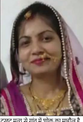
एक घर से उठी तीन अर्धियां, हर आंख हुई नम

भैरूदा तहसील का बोरखेड़ा बामन गांव, जहां पर हर दिन की तरह सब कुछ सामान्य था. लोग अपनी दिनचर्या में व्यस्त थे, किसान खेतों की तरफ जा रहे थे, इसी दौरान गांव में एक खबर सुनाई दी. इसके बाद गांव में पूरी तरह से मातम छा गया. लोगों तक यह खबर पहुंची वे गमगीन हो गए और सब अपने कामों को छोड़कर पुरोहित परिवार के घर पर पहुंचने लगे. गांव में पूरी तरह से मातम छा गया. पुरोहित-शर्मा परिवार पर तो वज्रपात हो गया. परिवार के तीन सदस्यों की दर्दनाक हादसे में मौत हो गई तो वहीं दो गंभीर रूप से घायल हो गए. जब गांव से तीनों की अर्धियां उठी तो गांव के बच्चे, युवा, बुजुर्ग, महिलाएं सभी की आंखें नम हो गईं. गांव वालों ने इससे पहले ऐसा दुख कभी नहीं देखा. एक साथ तीन अर्धियां देखकर कोई भी अपने आपको नहीं रोक पाया.