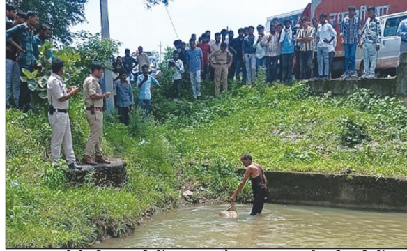
मृतक नहाने के लिए पानी में उतरा होगा और डूब गया होगा. पुलिस ने मर्ग कायम कर शव को पीएम के लिए भेजते हुए शिनाख्त के प्रयास प्रारंभ कर दिए हैं. गौरतलब

जानकारी के अनुसार मंडी थाना क्षेत्रांतर्गत आने वाले ग्राम जताखेड़ा के समीप बहने वाली नदी में एक व्यक्ति का शव तैरता नजर आने पर वहां सनसनी का माहौल निर्मित हो गया. सूचना मिलने पर पहुंची पुलिस ने शव को बाहर निकलवाते हुए उसकी शिनाख्त करने का प्रयास किया, लेकिन शिनाख्त नहीं हो सकी. पुलिस सूत्रों की माने तो लगभग 30 वर्षीय युवक का शव एक से दो दिन पुराना है. मृतक के कपड़े पुलिया की दूसरी तरफ रखे पाए गए हैं तथा उसकी जेब में एक निजी बस का टिकट भी मिला है. संभावना जताई जा रही है कि