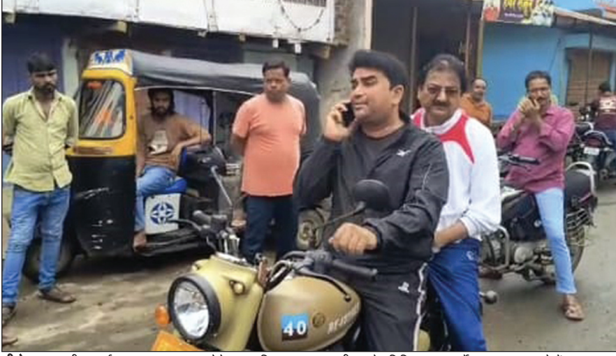
सीहोर. नगर की सफाई व्यवस्था का जाएजा लेने नगरपालिका अध्यक्ष व सीएमओ प्रतिदिन सुबह वार्डों का भ्रमण कर रहे हैं.

► सफाईकर्मियों वार्डों में नहीं दिखे तो होगी कार्रवाई ► नपा की कार्यशैली को देखकर लोगों ने जताई प्रसन्नता