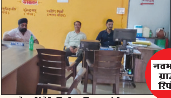
तूमैन में बैठे मिले सचिव एवं रोजगार सहायक