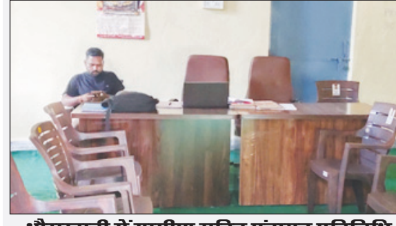
भौराखाती में ग्रामीण सहित पंचायत प्रतिनिधि

स्तर पर जनसुनवाई कार्यक्रम की व्यवस्था की गई, लेकिन जब नवभारत द्वारा ग्राम पंचायत स्तर की जनसुनवाई कार्यक्रम को लेकर पड़ताल की गई, तो पंचायत भवन तो खुले मिले, लेकिन उनमें पंचायत प्रतिनिधि के अलावा कोई नहीं मिला। वहीं पंचायतों में