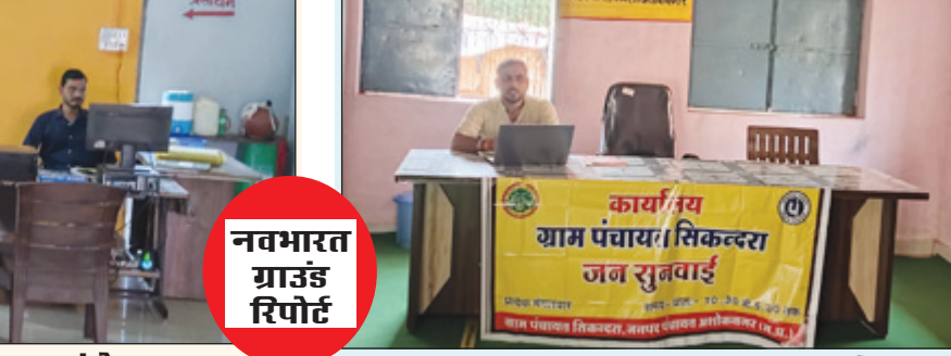
सिकंदरा में सहायक सचिव चलाते मिले लैपटॉप

मंगलवार बीत चुके हैं। दरअसल मंगलवार को आयोजित जनसुनवाई में जिला मुख्यालय पर बड़ी संख्या में लोग अपनी