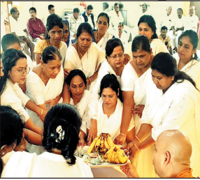
पूज्य भन्ते जी को भोजन दान किया तथा धम्मदान भी किया।

भोपाल. तुलसी नगर स्थित करुणा बौद्ध विहार में रविवार को प्रातः 10.30 बजे उपस्थित उपासक-उपासिकाओं को त्रिशरण पंचशील ग्रहण कराई गई। पूज्य भन्ते ने कहा कि वर्षावास का यह काल उपासकों के लिए अधिक से अधिक धम्म लाभ लेने के लिए उपयुक्त है, क्योंकि इस अवधि में पूज्य भन्ते गण किसी न किसी विहार में रहकर धम्मा का अध्ययन करते हैं तथा उपासकों को भी धम्म की विस्तृत जानकारी देते हैं। इस अवधि में अधिकतर उपासक पूज्य भिक्षुओं के सम्पर्क में रहकर धम्म का ज्ञान अर्जित करते हैं। साथ ही उपासकों द्वारा पूज्य भन्ते को अपने निवास पर सुख, शांति, समृद्धि और घर के वातावरण को शुद्ध कराने हेतु परित्राण पाठ के लिए आमंत्रित कर उन्हें भोजन दान तथा धम्मदान भी कराते हैं। इस अवसर पर महिला मंडल ने पूज्य भन्ते जी को भोजन दान किया तथा धम्मदान भी किया।